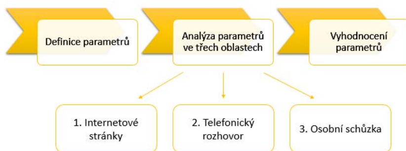
Schéma 1 - Postup při analýze nebankovních subjektů v roce 2015

První analyzovanou oblastí byly internetové stránky vybraných společností. Zde se odborníci UMBRELLA zaměřili především na dostupnost informací. Mimo jiné také hodnotili přehlednost webových stránek, akční nabídky a výhody oproti konkurenci.